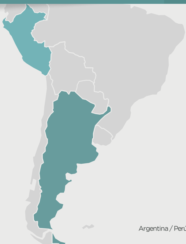
Argentina / Perú

captan, almacenan y transportan agua para consumo familiar y animal, mejoran sus sistemas de riego, cultivan especies forrajeras como banco de proteína y/o energía y se vinculan a mercados locales a través de ferias y/o ventas asociativas.